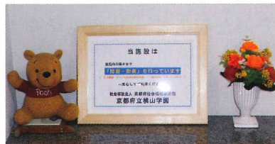
除菌・脱臭宣言 (オゾン発生器導入)